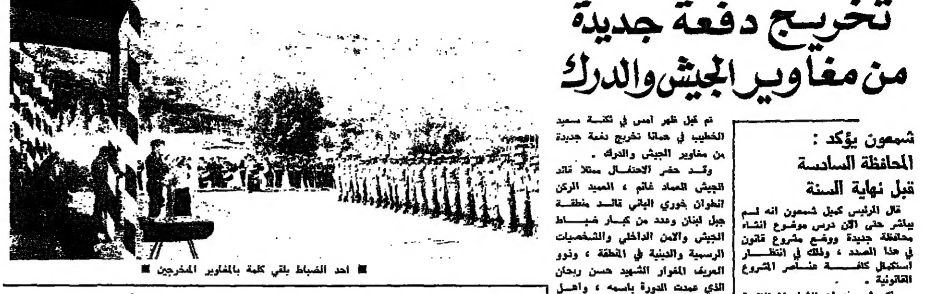
احد المغاور المحررين يمس على العلم